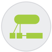
Plan de Cuenta