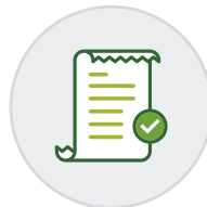
Formato ticket activo para Boleta Electrónica