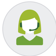
Asesoría necesaria para imprimir sin problemas