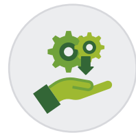
Instalación remota rápida y asistida