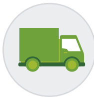
Despacho a domicilio