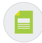
Documentos no asociados